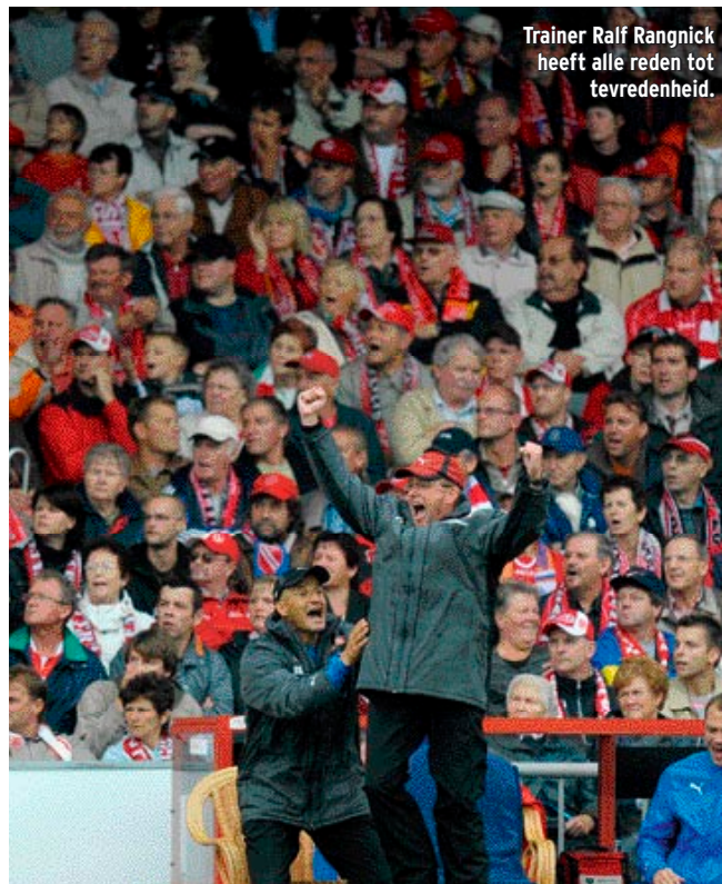
Trainer Ralf Rangnick heeft alle reden tot tevredenheid.